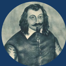
SAMUEL DE CHAMPLAIN (1567-1635)

Navigateur et Explorateur Français Découvreur du Canada en 1534