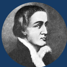
PAUL DE CHOMEDEY DE MAISONNEUVE (1612-1676)

Navigateur, Cartographe et Explorateur Français Fondateur du Québec et de la Nouvelle France