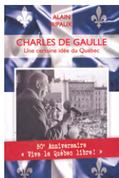
CHARLES DE GAULLE UNE CERTAINE IDÉE DU QUÉBEC - ALAIN RIPAUX