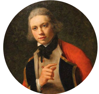
James Wolfe (1727-1759) Général Britannique peint par Nathaniel Hone

A partir de 1760, les troupes britanniques ont envahi tout le Canada et la province de Québec est devenu une colonie anglaise. Les 60 000 Canadiens français devenaient des sujets britanniques. Après un siècle d'occupation britannique, le Québec est devenu en 1867, l'une des quatre provinces de la confédération canadienne.