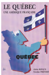
LE QUÉBEC, UNE AMÉRIQUE FRANÇAISE - ALAIN RIPAUX & NICOLAS PRÉVOST