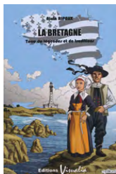
LA BRETAGNE, TERRE DE LÉGENDES ET DE TRADITIONS - ALAIN RIPAUX