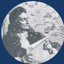
RENÉ-ROBERT CAVELIER DE LA SALLE (1643-1687)

Explorateur-voyageur Français Découvreur de la vallée de St-Laurent et du delta du Mississippi