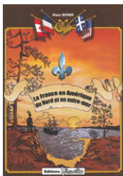
LA FRANCE EN AMÉRIQUE DU NORD ET EN OUTREMER - ALAIN RIPAUX