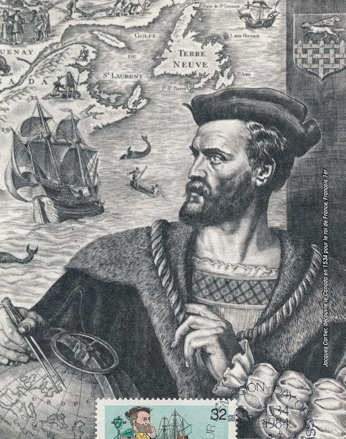
Jacques Cartier, découvre le Canada en 1534 pour le roi de France, François Ter