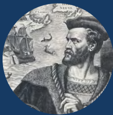
JACQUES CARTIER (1491-1557)

Navigateur et Explorateur Français Découvreur du Canada en 1534